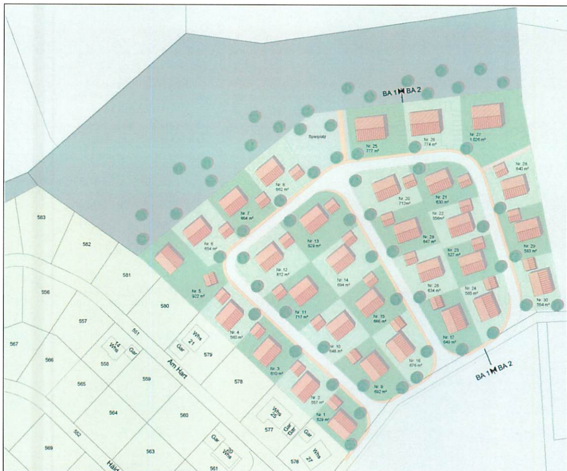
Städtebaulicher Vorentwurf (ohne Maßstab)

Die an das Baugebiet angrenzenden Flächen werden durch zwei nach Norden und Osten verlaufende Wirtschaftswege erschlossen.