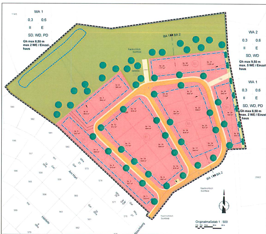
Rechtsplan (ohne Maßstab)